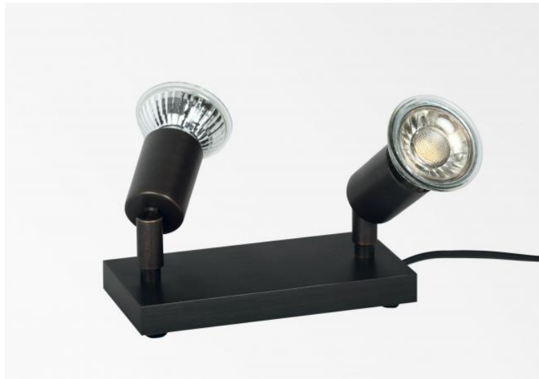
MERCURE PL2 en bronze griffé